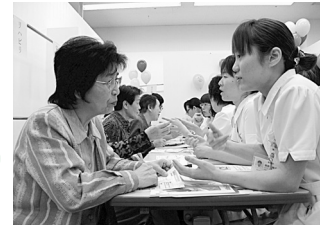
健康相談や手洗い指導