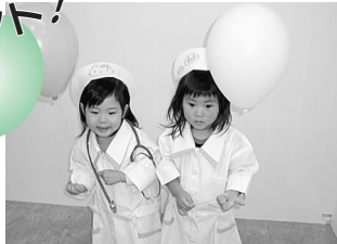
白衣での記念撮影