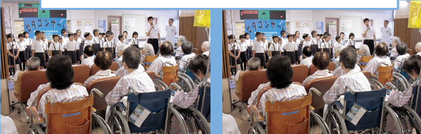
吉島小学校2年3組のみなさん