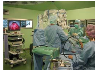
顕微鏡を使った手術の実際

再出血が起こり、重症化する前に適切な処置を行うと、社会復帰も可能です。当院でも治療後、会社員、病院事務等と現職復帰を果たし、発症前と変わりなく元気に働いている方々もおられます。不明な点に関してはいつでも脳神経外科外来にお問い合わせください。