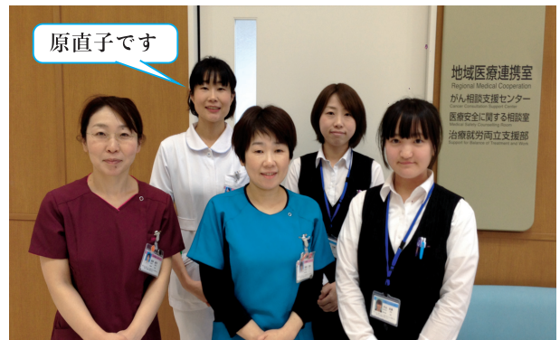
地域医療連携室 がん相談支援センターのメンバーです

普段、家族や友人に病気のことを打ち明けたり、経済的なことを相談するのは、難しいこともあると思います。がん相談支援センターでは、患者様とご家族を支えるお手伝いをさせていただきたいと思っています。