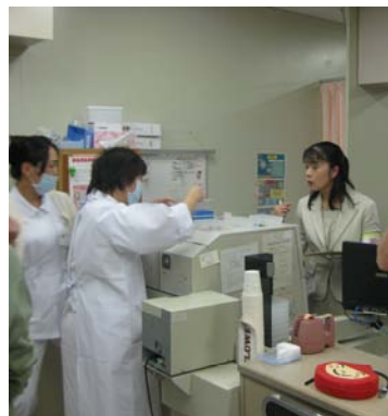
北陸3 労災病院による相互チェック

また北陸3(富山・新潟・燕)労災病院の相互チェックや院内ラウンドを行い安全の確保に努めております。