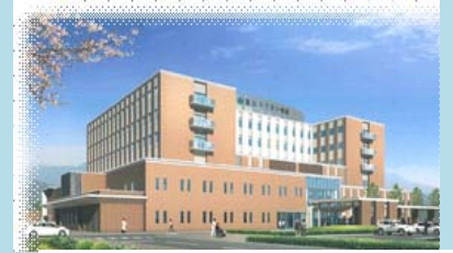
H28年 新病院完成予想図